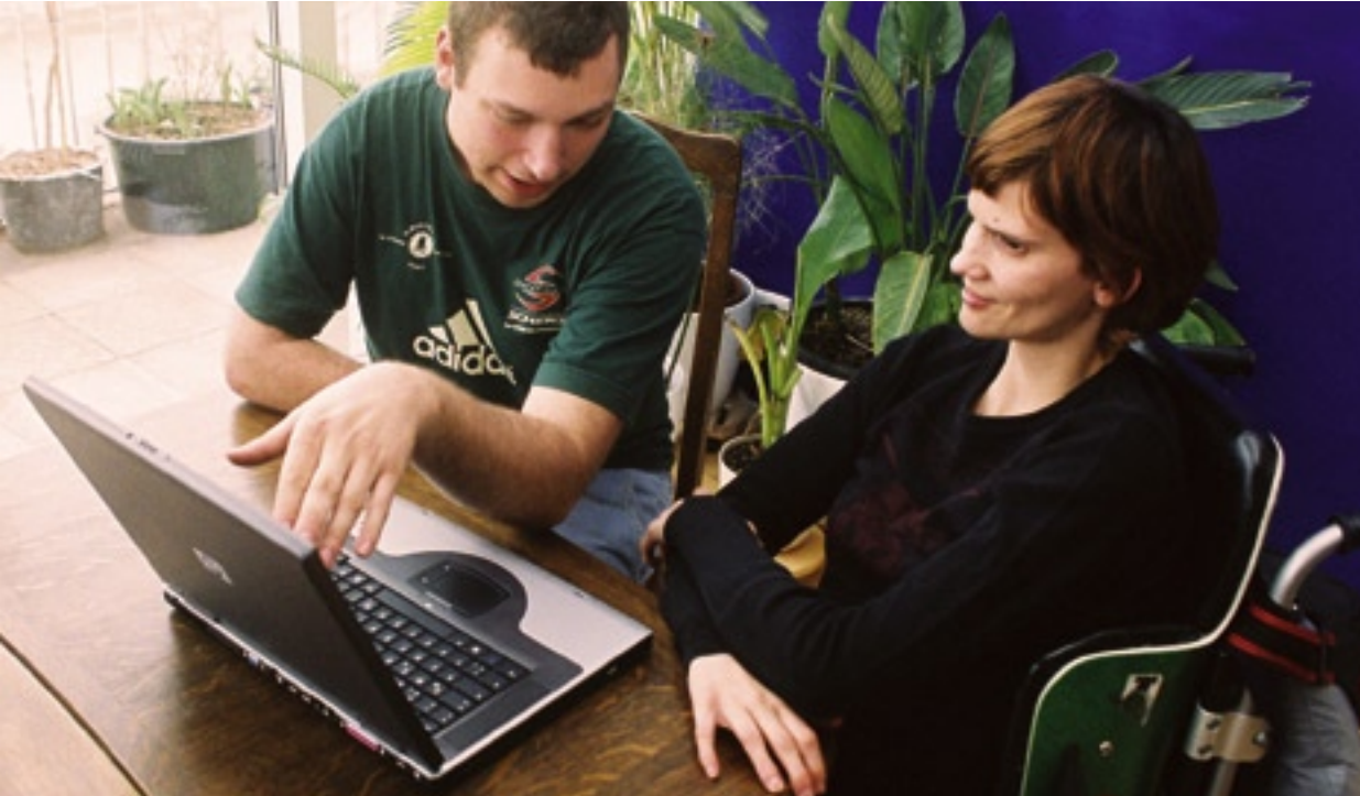
Nueva-Evaluator und Evaluatorin